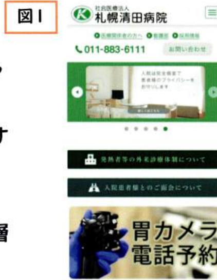
病院ホームページから予約案内ページにアクセスできます。

特に近年は内視鏡診療に重点を置いており、スクリーニング検査と内視鏡的粘膜下層剥離術(ESD)を中心とした早期がん治療に力を入れています。